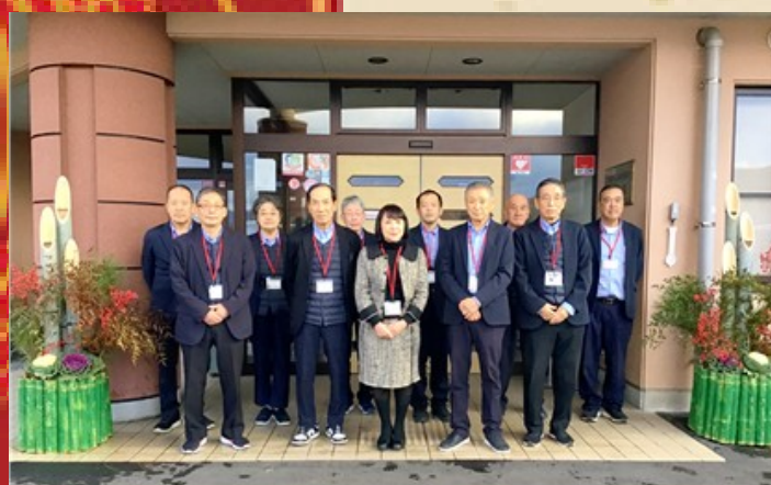
介護老人保健施設 精彩園