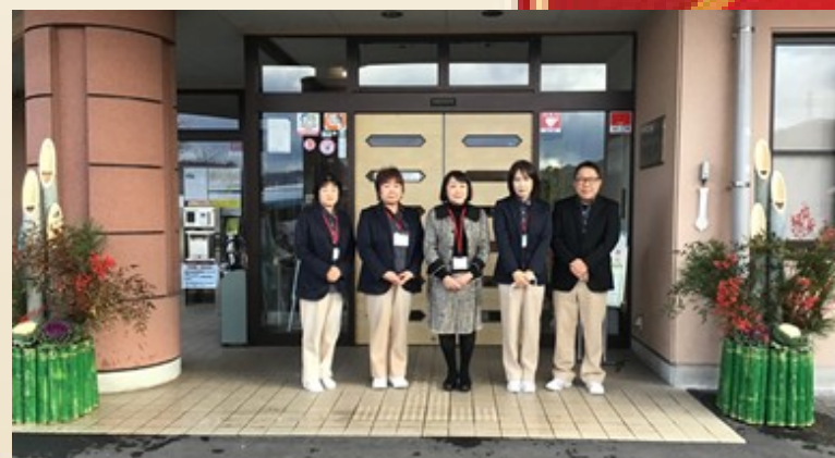
精彩園居宅介護支援事業所