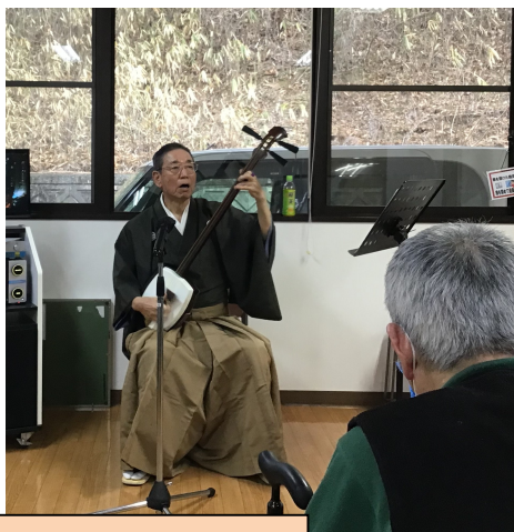
送迎スタッフによる三味線、尺八の演奏