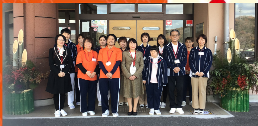
介護老人保健施設 精彩園