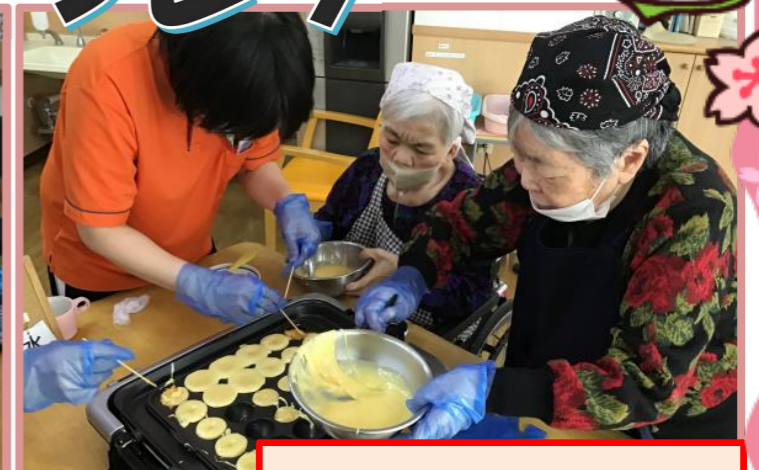
ベビーカステラ作り